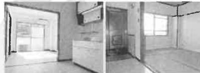
■南側居室 ■北側和室