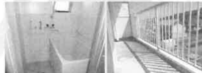
■お風呂 ■バルコニー