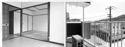
■南側和室 ■バルコニー