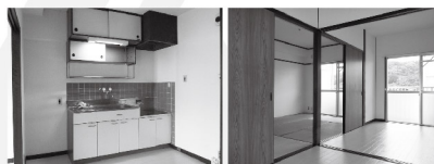
■ダイニングキッチン ■南側居室