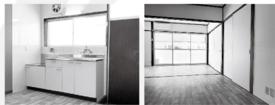
■ダイニングキッチン ■居室